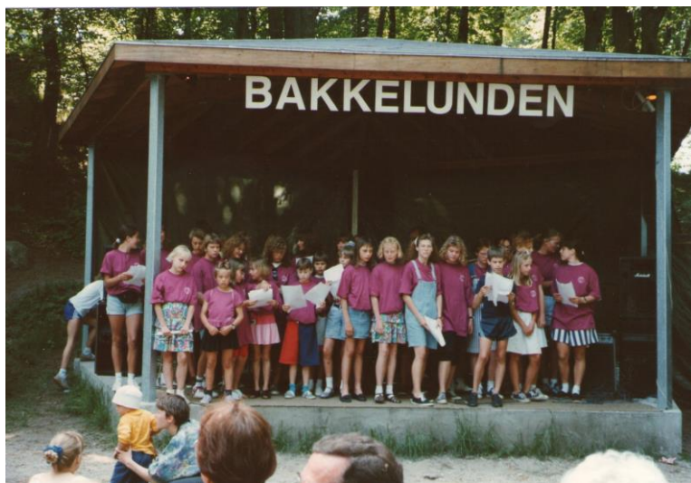
Kværndrup Skoles kor ved indvielsen den 30. maj 1992

Mange af sangforeningens aktiviteter, som havde med musik at gøre, var gennem årene blevet henlagt til Bakkelunden. Det fik Borgerforeningen til i begyndelsen af 1990'erne at søge Egeskov Markedsforening om støtte til opførelse af en musikpavillon i Bakkelunden. Musikpavillonen blev indviet den 30. maj 1992 under stor festivitas. Rammerne var nu bragt i orden, desværre har tiden ikke været til, at musikarrangementer som i sangforeningens dage, har kunnet gennemføres.