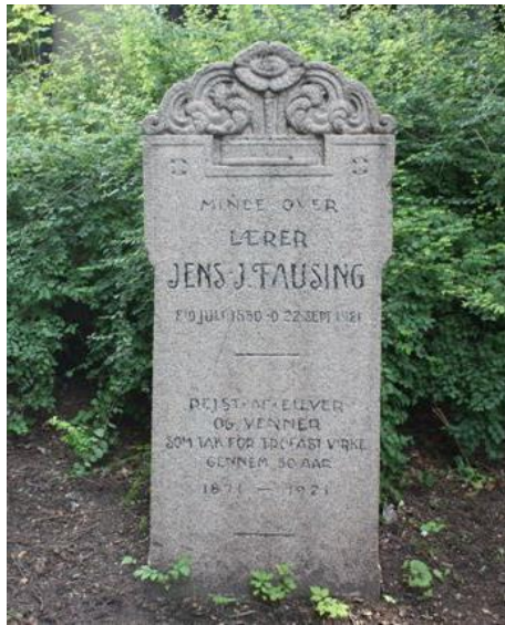
Mindesten over Fausing